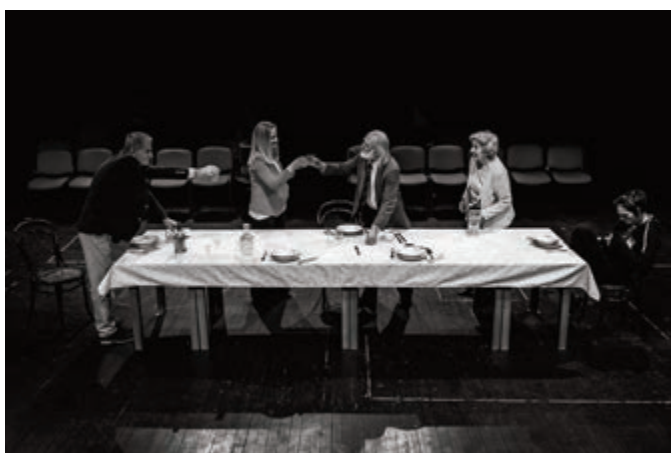
Sarajevsko „Brašno u venama“

Riječ je o praiizvedbi Štiksovog teksta, koji govori o emocionalnom i ideološkom jazu generacija i suočavanju sa prošlošću, kao bitnim segmentima budućnosti. Dramatizaciju je