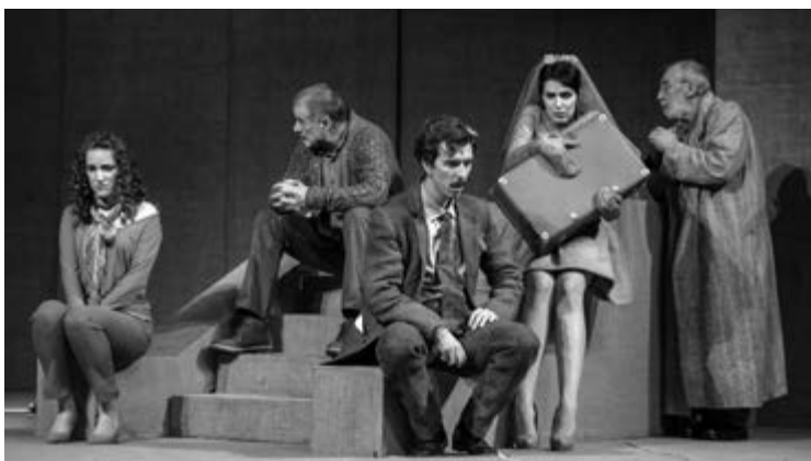
„Urnebesna tragedija“

„Od trenutka kada je napisan komad do danas proteklo je dvadeset i više godina i mnogo toga se i u nama i oko nas promijenilo. Svađe tzv. komunista i tzv. građana, s kraja