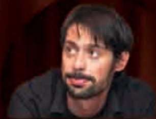
Milan Vasić Pozorište širi vidike