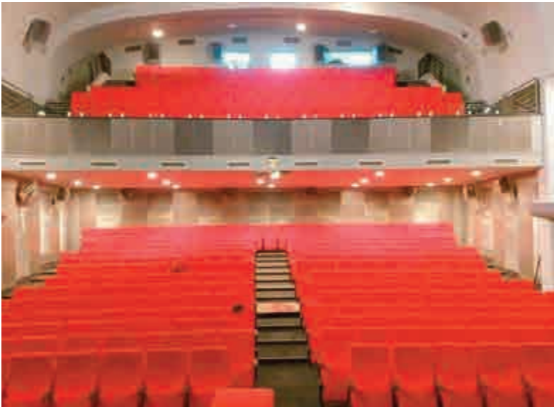
Sala Nikšićkog Pozorišta

Nastaviće se i sa gostovanjima premijernih projekata koji su rađeni krajem minule sezone. Imperativ produkcije je da obezbijedi i njihova izvođenja van Crne Gore, jer se na taj način najbolje valorizuju sopstveni potencijali u zemljama okruženja. Gostovanjem u drugim sredinama otvaraju se mogućnosti za razmjenu programa na komercijalnoj osnovi, a susreti sa pozorišnim stvaraocima iz drugih sredina bitni su i radi razmjene iskustava i upoznavanja dramskih stvaralaca.