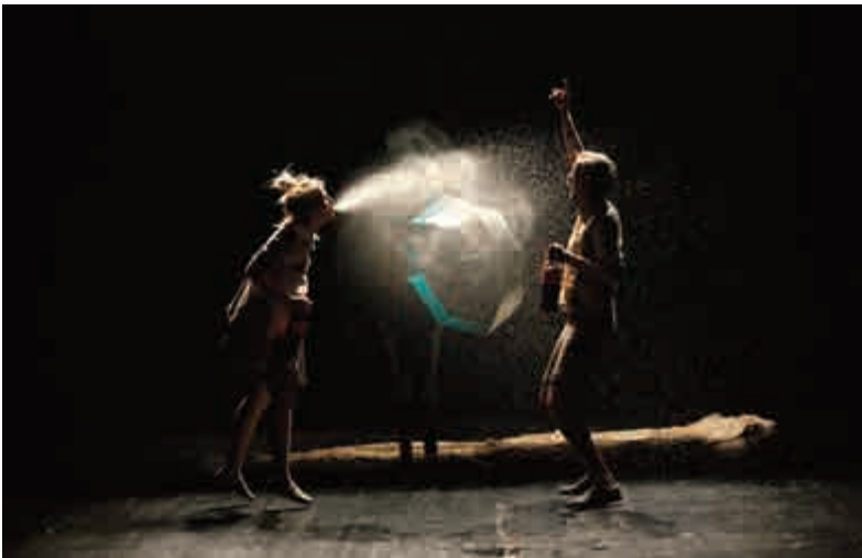
„Ivica i Marica“, predstava za djecu u režiji Mirka Radonjića

Cijenim da su neke stvari sada postavljene na viši nivo, ali isključivo u produkcijskom smislu, ne i u umjetničkom. To je ono što me na kraju, uvijek izbaci iz takta. „Super! Sad imamo divne reflektore...“ – često se, između ostalog, čuje. Ali šta sa njima, ako nema dešavanja na sceni?