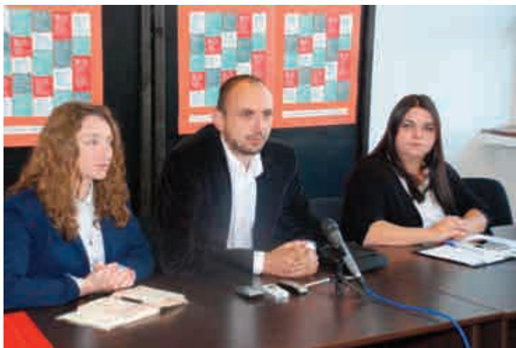
Sa pressa manifestacije „Srećan rođendan Živko“

„Živko je zaslužio da se njegovim imenom zove veliki filmski studio, koji bi se mogao izgraditi u Nikšiću, recimo u Domu revolucije. On je svojim stvaralaštvom mnogo više zaslužio od podizanja memorijalnog centra“, istakao je Eraković. Živko, je prema ocjeni Erakovića, bio poeta filma, koji je na jedinstven način „naslikao“ narod ovog podneblja. „Erik From je rekao da narod koji ne može da uoči svoje negativne strane ne zaslužuje da bude narod. Ako se po tome računa, mi smo daleko ispred naroda iz ovog dijela Evrope, što su pojedini naši stvaraoci uspjeli da urade. Ali niko nije imao to poetsko i sinestetičko nadahnuće, kao Živko“, zaključio je Eraković.