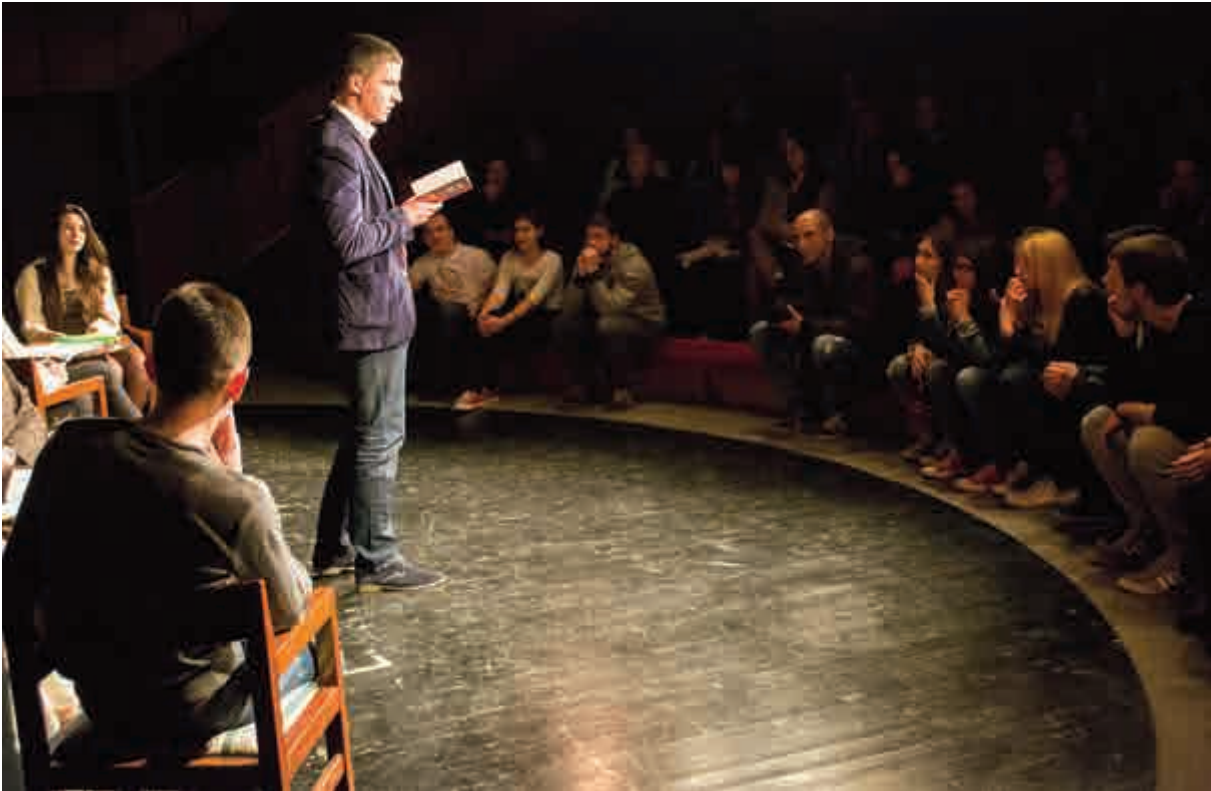
Literate „Poenta poetike“ u sali Dodesta

tom računa o njenim prohtjevima i željama, ali istovremeno zahtijevajući od nje određeni nivo poznavanja književnosti i kulturnog ponašanja. Iako se danas često može čuti „da mladi nijesu kulturni na javnim mjestima“, „Poenta poetika“ to demantuje, jer njeni članovi i publika grade jedan novi svijet: ljepši, kulturniji, obrazovaniji i prefinjeniji, kako u djelima mladih stvaralaca, tako i u stvarnosti.