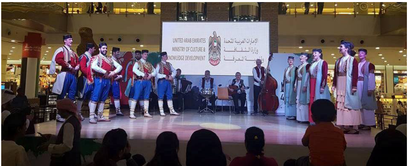
Folkloriši KIC-a u Ujedinjenim Arapskim Emiratom

Folklorni ansambl KIC-a „Budo Tomović“ koji baštini tradiciju dugu 70 godina, krajem maja gostovao je u Izmiru (Turska) u okviru Festivala folklor zemalja Balkana, čime je nastavio da