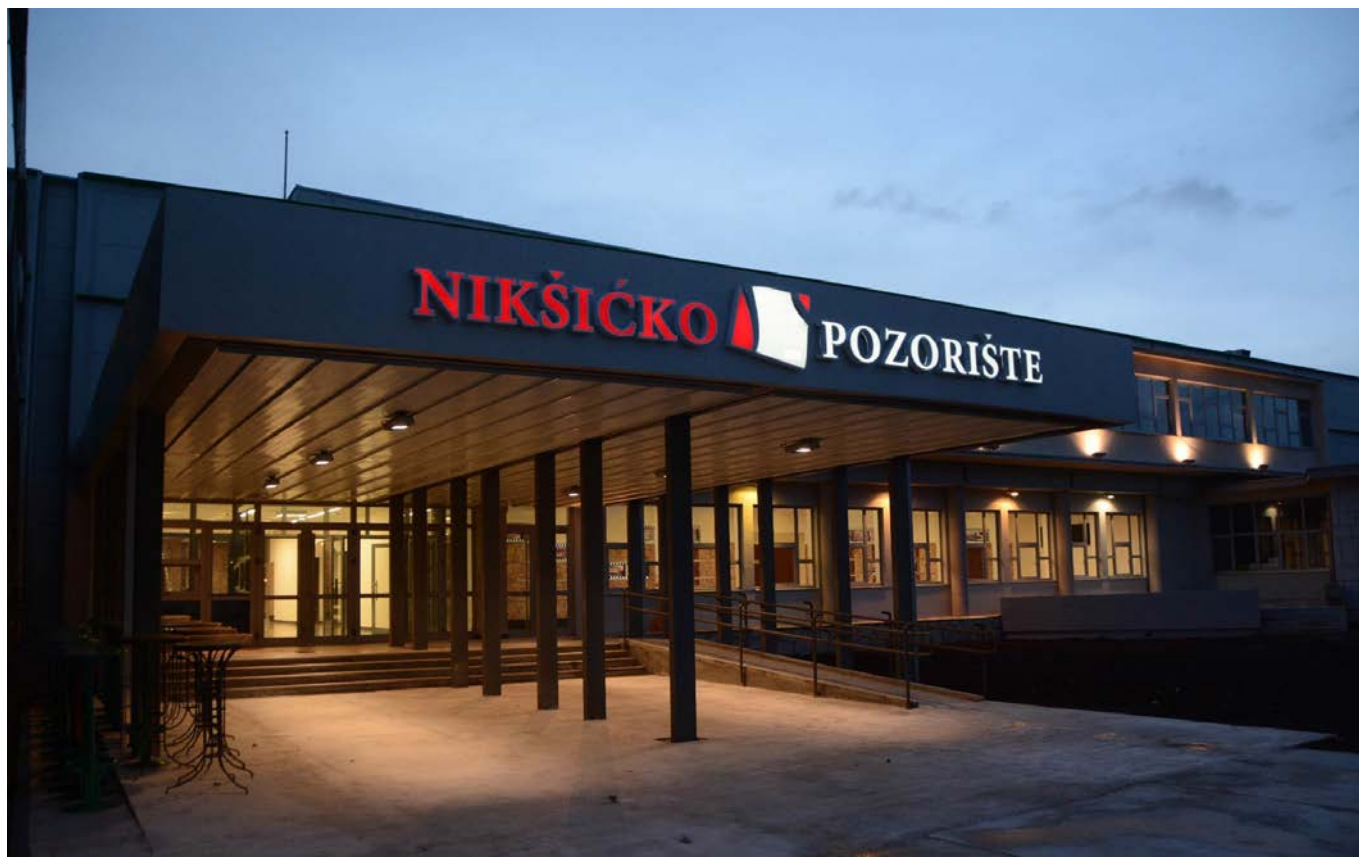
Nikšićko pozorište hram kulture

Prioritet u radu ustanove bio je unapređenje sopstvene produkcije, ali i uspostavljanje intezivnije saradnje sa drugim pozorišnim kućama u zemlji i regionu. Rezultati te zacrtane i do kraja realizovane programske politike vidno su unaprijedile produkciju ustanove, pa su posljednje dvije pozorišne sezone