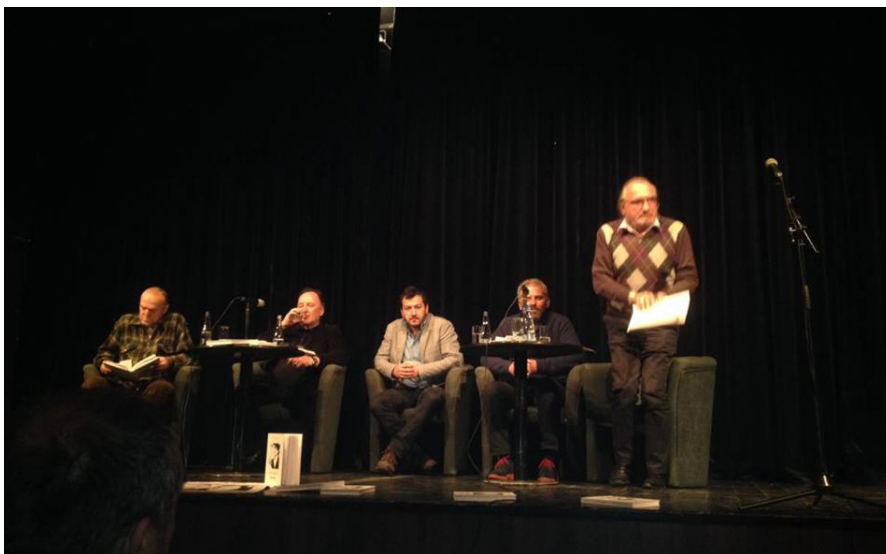
Sa promocije knjige „Sabrana djela I – Poezija“

Stihovi slavne poeme „Idem da je volim“, tragično preminulog pjesnika Spasoja Paja Blagojevića, čuli su se na promociji knjige „Sabrana djela I - Poezija“, pred brojnog