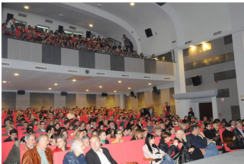
Publika na ovogodišnjem Festivalu

Etablirani pozorišni komadi festivalskog repertoara okupili su plejadu glumačkih velikana, koji su virtuosnim umijećem velikom broju publike iz Nikšića i cijele Crne Gore, pootvrdili maksimu da je „ pozorišna umjetnost mnogo više od same te riječi i puke zabave “, odnosno da je to mjesto susreta čovjeka sa čovjekom i da je mjesto koje intezitetom emocija hvata korak sa životom, ili grabi jednu stepenicu ispred njega. Istinitost ovih tvrdnji nijesu samo proizvod subjektivnog doživljaja viđenog iz reporterskog reda, već i iskustvenog: „ Na ovogodišnjem Festivalu je toliko dobrih glumaca, može se reći velikana koji su prezentovali svoje znanje, dar