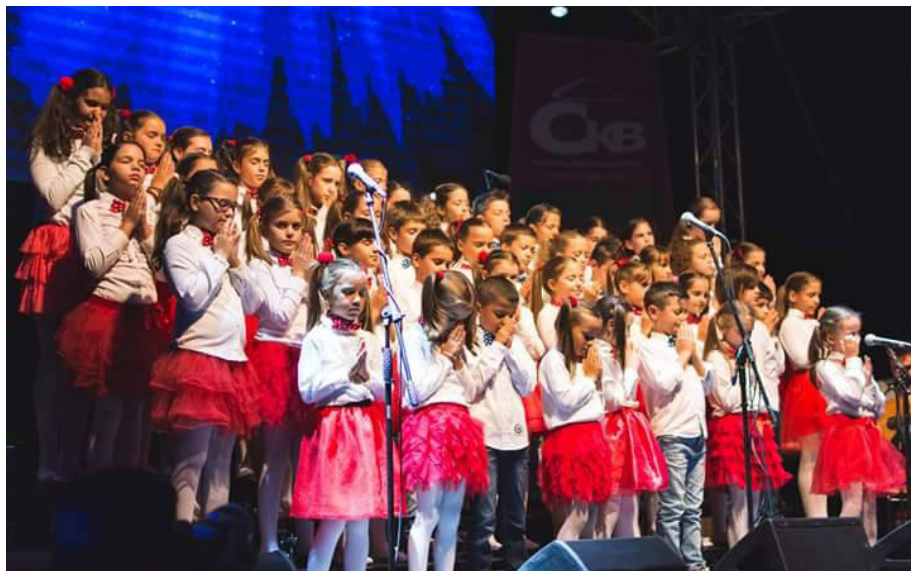
Mali hor na sceni Bedema

„Hor najmlađih u ovoj obrazovnoj ustanovi postoji tri godine. Nastao je iz jedne ‘slučajne priče’, jer sam željela da putem dodatnih časova na kojima bismo neobavezno pjevušili dječije pjesmice, postignem motivaciju za bavljenjem solfedom i instrumentom. Tako je krenula naša magična