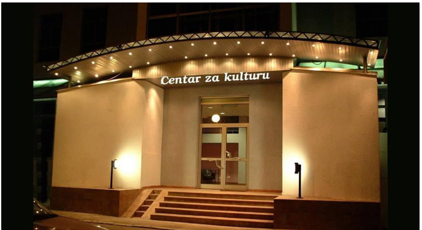
Zgrada Cenra za kulturu u Bijelom Polju

„Nema opravdanja da sjever Crne Gore ne posjeduje jedno profesionalno pozorište. Sve ove navedene inicijative su put ka profesionalizaciji svih segmenata kulture u gradu. Ne možemo preko noći sve rješavati, ali važno je uspostaviti plan koji će se sa sigurnošću realizovati u budućem periodu. Naši glumci, koji su afirmisali i grad i pozorište, podigli su ljestvicu na najveći nivo i možemo reći