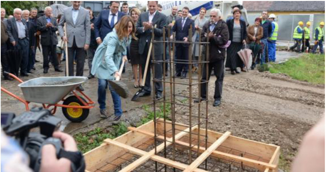
Detalj sa polaganja kamena temeljca zgradi Gradskog pozorišta