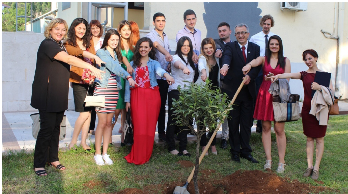
Polaznici Škole retorike posadili su drvo lovora ispred zgrade KIC-a

saradnje sa institucijama kulture, kulturnim centrima i brojnim NVO-ma u Crnoj Gori, je usmjerena ka inostranim kulturnim institucijama i ambasadama i konzularnim predstavništvima država svijeta u Crnoj Gori. Dosadašnjem bogatom spisku inostranih saradnika, ove godine pridružila su se ambasade Finske i Kanade u Podgorici, te ambasade Indije u Beču i Argentine u Beogradu.