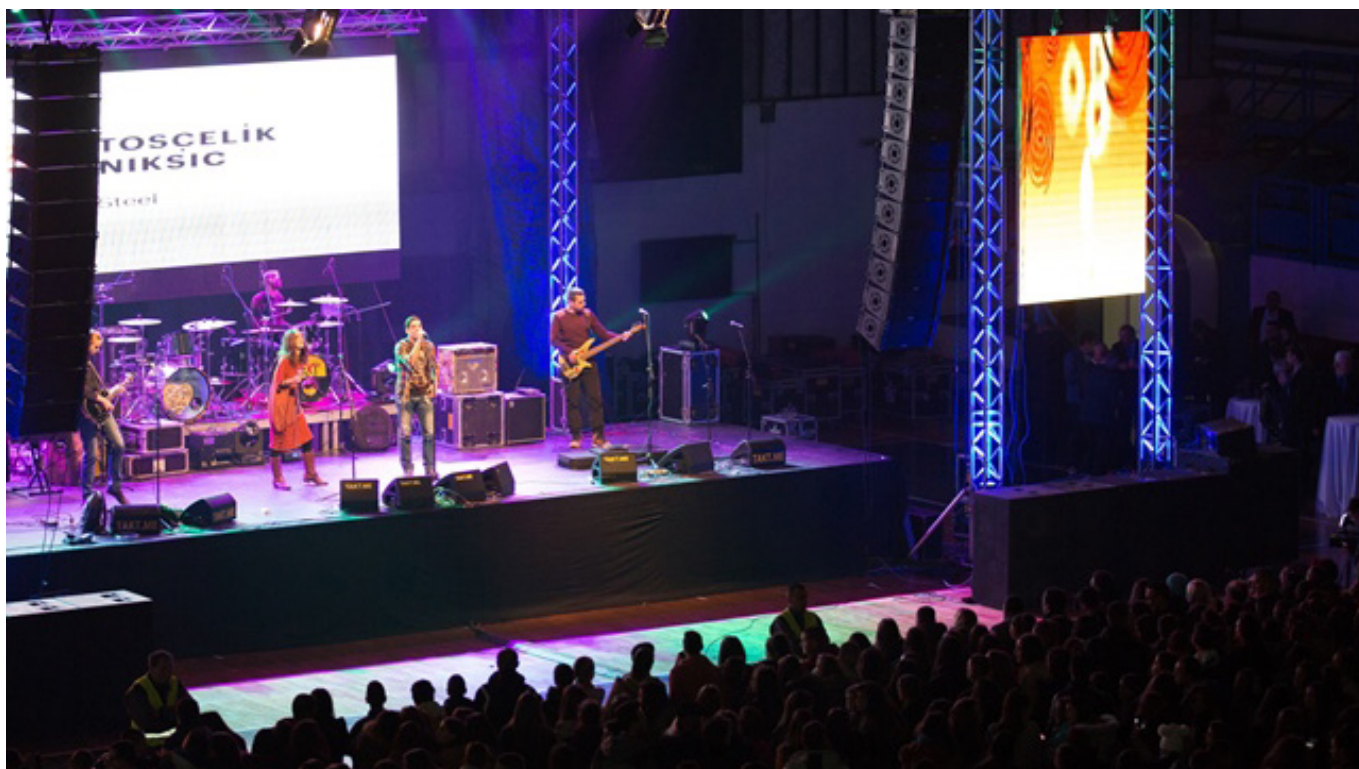
Van Gogh u Sportskom centru u Nikšću

Turska kompanija cijeni da je Nikšićko pozorište jedinstvena učionica kulture, jer je jedna od najprestižnijih ustanova u ovom gradu. Pozorište će i u buduće biti omiljeno mjesto za djecu metalurga, ali i njihove roditelje. Zbog toga će Tosčelik Nikšić, u narednom periodu, upravo kroz promociju projekata u oblasti kulture, biti jedan od