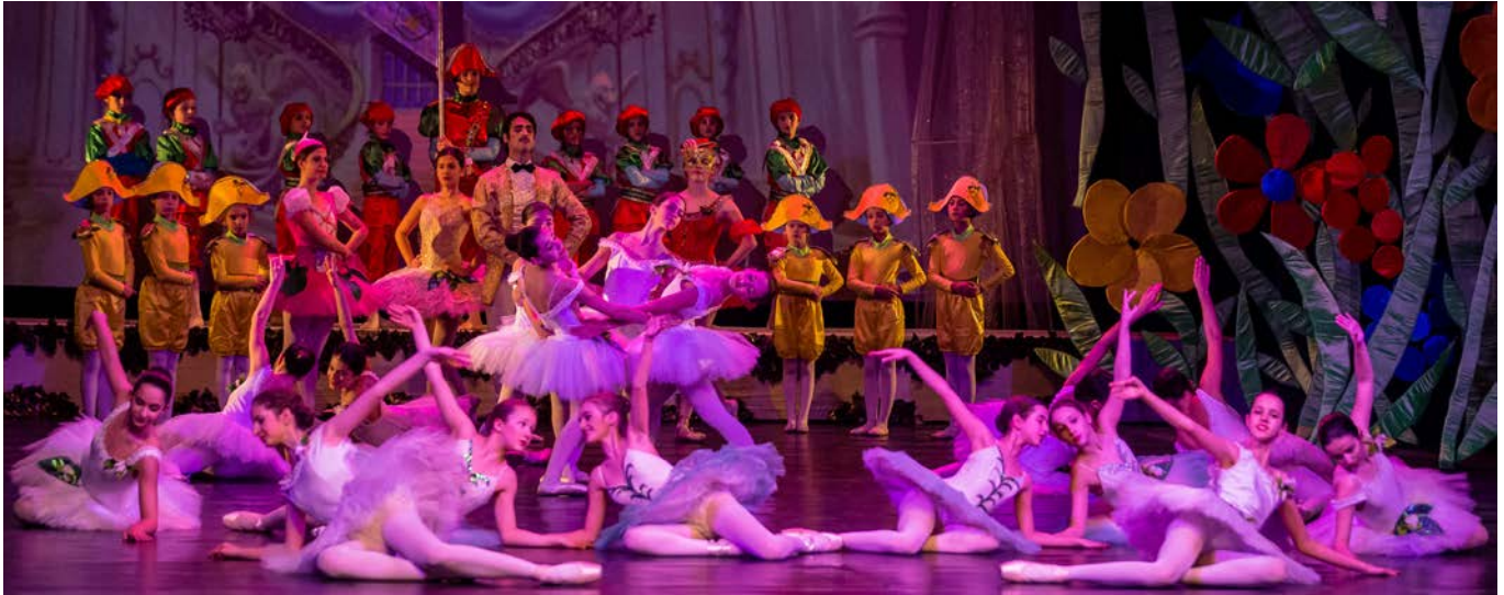
Mlade balerine na Velikoj sceni CNP-a