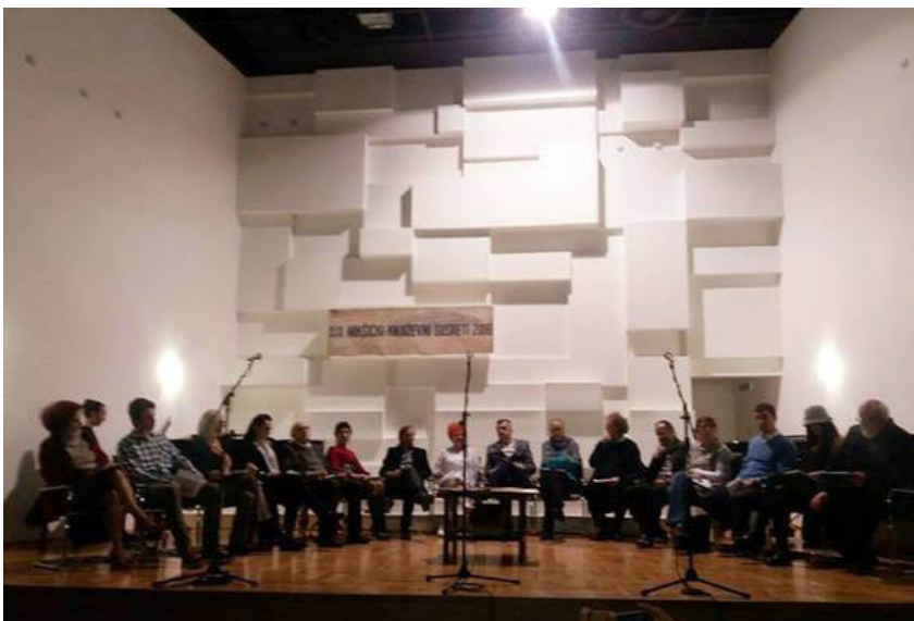
Detalj sa ovogodišnjih „Nikšićkih književnih susreta“

se sa učenicima tih škola. Bila je to izuzetna prilika da djeca koja posjeduju talenat za pisanje svoje prve radove pročitaju pred svojim idolima i od njih dobiju neophodnu podršku za dalje bavljenje poezijom. Ovaj segment programa osim što je imao za cilj popularizaciju poetske riječi i književnosti, pružio je i šansu za afirmaciju mladim poetama. Druženje sa pjesnicima potvrdilo je da je Nikšić rasadnik talenata kada je poezija u pitanju. Pisci su obišli i korisnike Dnevnog centra za djecu sa smetnjama u razvoju, koje su tom prilikom obradovali svojim stihovima i prigodnim poklonima. U sali Nikšićkog pozorišta, kao poseban poklon oučenicima osnovnih škola, uzrasta od II do VI razreda priređen je poetsko-muzički hepening Dejana Đonovića , poznatog