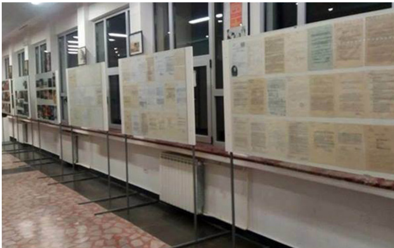
Sa izložbe „Kinematografija u Nikšiću“