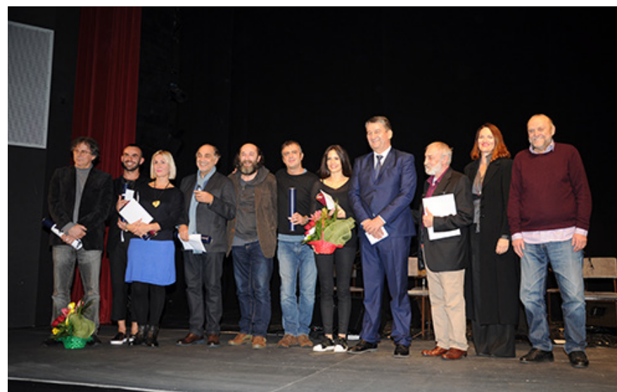
Još jedna uspomena na Festival / Detalj sa svečanosti dodjele nagrada

životom, „ koji će raskrivati najtananije postore ljudske duše i koji će ljudima biti potreban kao hljeb nasušni “.