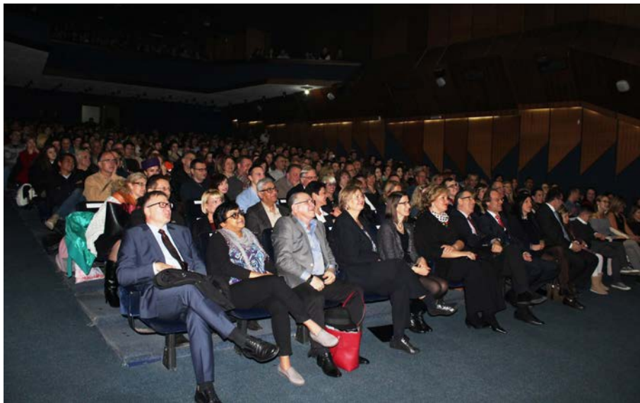
Publika u sali KIC-a

polaznika DODEST-ove škole glume Studentskog teatra. Kao i svih prethodnih i ove godine, KIC je pružao tehničko - organizacionu podršku