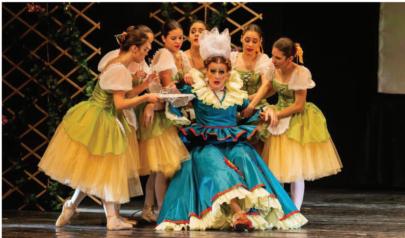
Velika scena CNP-a: sa premijere baleta „La fille mal gardee“

„La fille mal gardee“ / „Uzaludna predostrožnost“ je adaptaciji poznatog komičnog baleta iz Francuske, sa kraja XVIII vijeka. Ova poznata baletska priča ili kako je još u slengu nazivaju