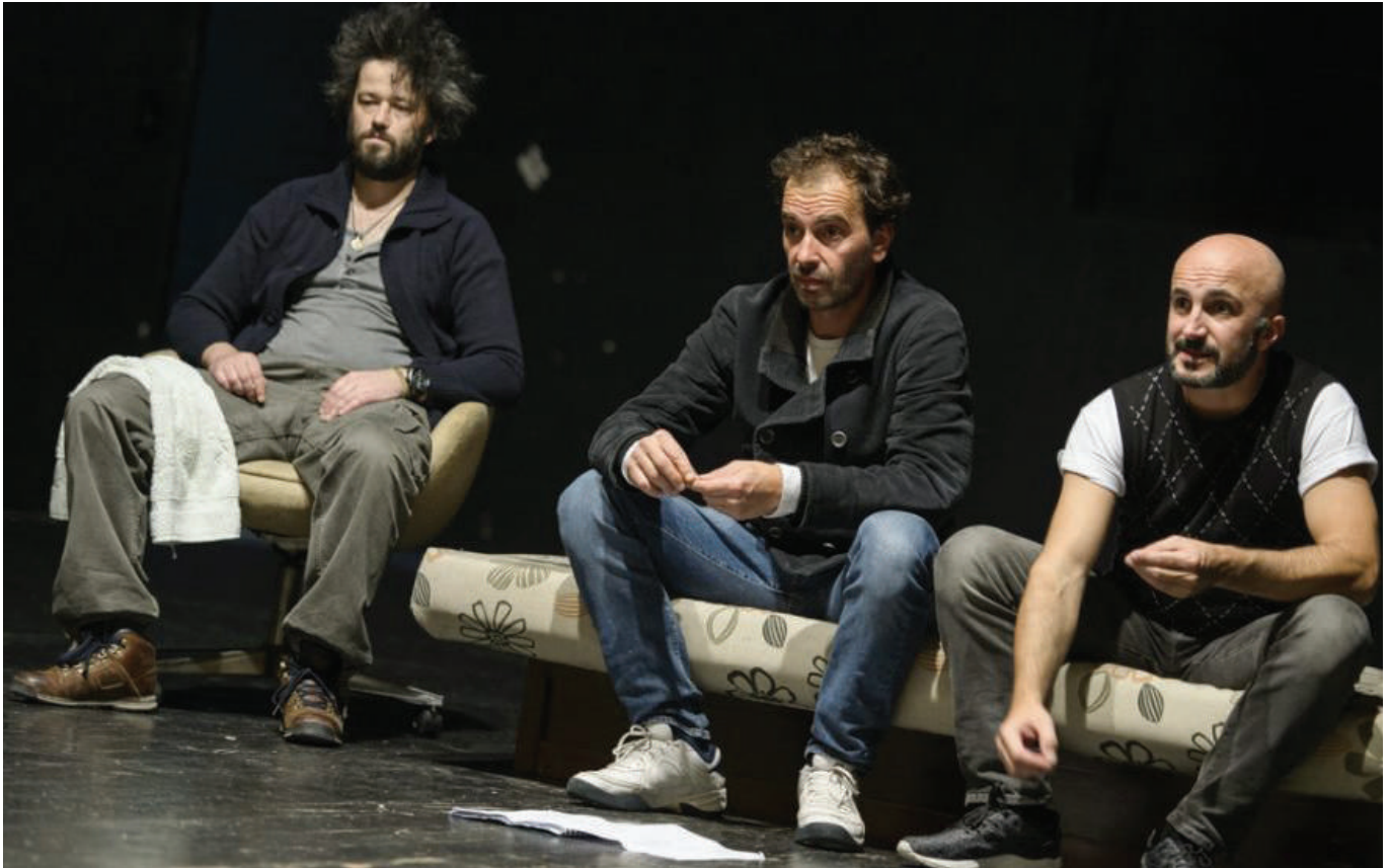
„Dokle pogled seže“ na pariskoj sceni

našu najbolju predstavu, kojoj evo i sad aplaudiram. Vidio sam da je cijela publika pratila komad, koji je u isto vrijeme tragičan i komičan. Predstava je u cjelini divna, a njena posebnost je u igri ovih glumaca. Originalni su! Razumjeli smo tematiku ovog komada. To je život! Imali smo večeras katarzu u pozorištu. Osjećam se kao ponosni Crnogorac. Glumci su igrali sa toliko ljubavi scene koje nijesu lake, ali su to činili sa dozom komedije. To nam je potrebno jer se moramo vratiti u stvarnost“ - utisci su princa Nikole Petrovića Njegoša.