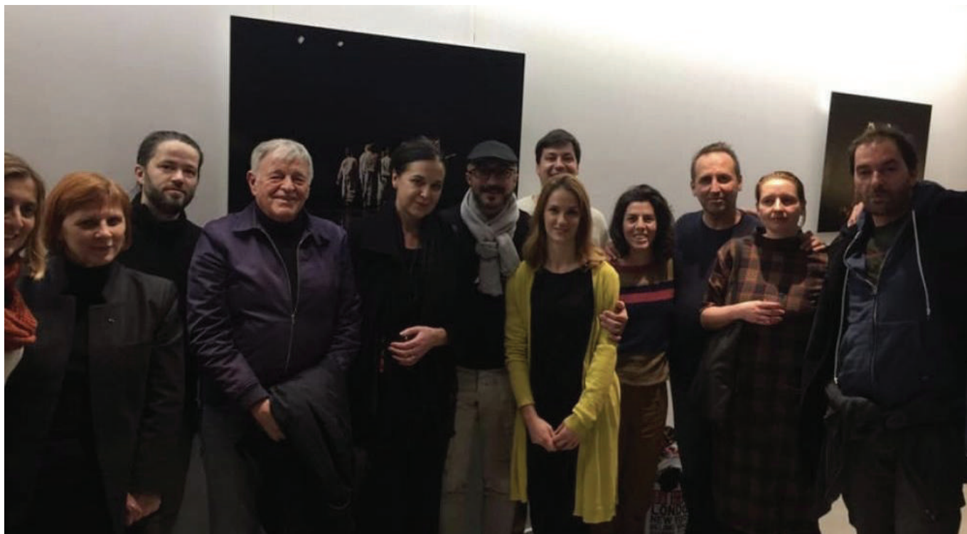
Glumci ansambla „Dokle pogled seže“ sa publikom u Parizu

od najreprezentativnijih u posljednjoj deceniji. No, nakon fantastične igre glumaca i odlične percepcije i reakcije publike, to gostovanje označilo je uspjeh ne samo Zetskog doma, već i crnogorske kulture. Pariz je, baš kao i mnogi drugi gradovi kojima je predstava „Dokle pogled seže“ hodila u protekłe dvije godine, burnim aplauzom pozdravio i ispratio