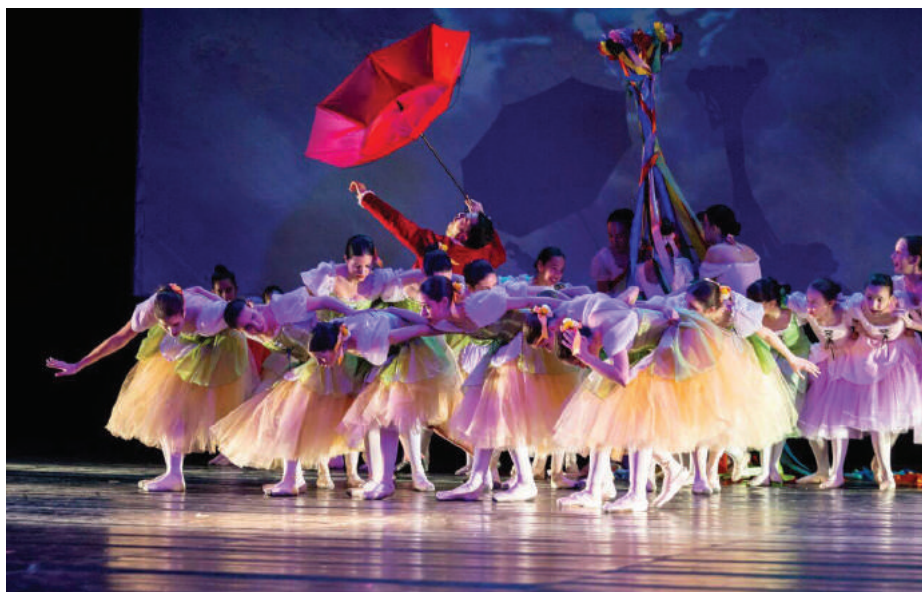
Balerine oduševile mnogobrojnu publiku

najavljuje zoru. Mladi momak Kolen dolazi pred kuću Mama Simone zbog njene vragolaste ćerke Lize. Njih dvoje su tajno zaljubljeni jedno u drugo. Ostavlja joj predivnu ružu na ulaznim vratima kuće. Dok ljubav Lize i Kolena raste, Mama Simona ima sasvim druge planove. Bacila je oko na sina bogatog zemljoposjednika, novopečenog bogataša. Alen je bogat, ali lud... Otac dovodi sina Alena u kuću Mama Simone da se mladi upoznaju. Prvi susret Alena sa Mama Simonom je šok za njega jer Mama Simona uvodi red. Upravo kada otac i Alen dolaze pred njihovu kuću zatiču Mama Simonu „kako praši Lizu po turu“. Od samog početka osjeća