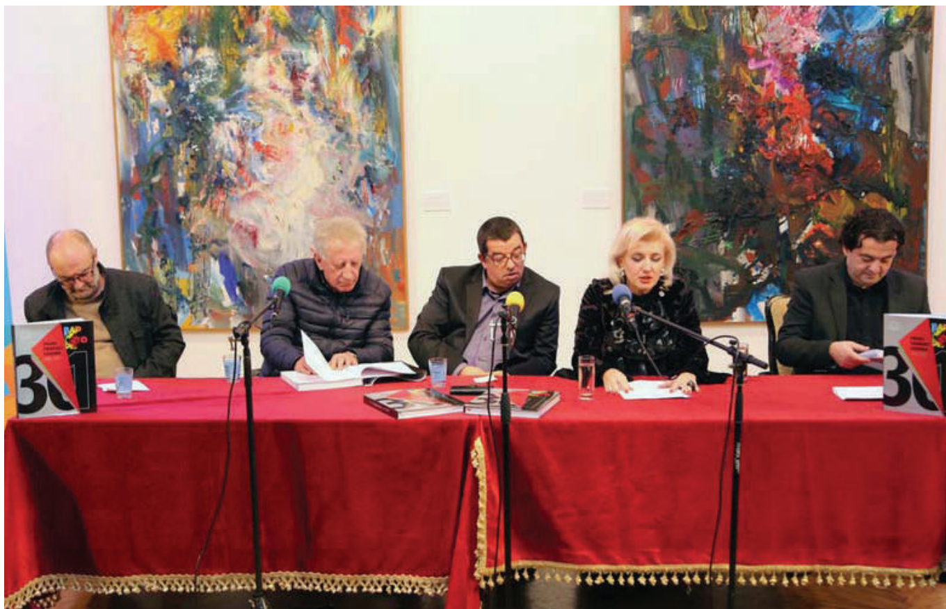
Bar: sa promocije mnografije, novembar, 2018. godine

„O tome svjedoči upravo ova knjiga, sa sviješću da Festival koji kreiramo danas, bi trebalo da zajedno sa prethodnih 30 izdanja, bude legat onima koji će ga naslijediti od nas. Oni će, kada budu