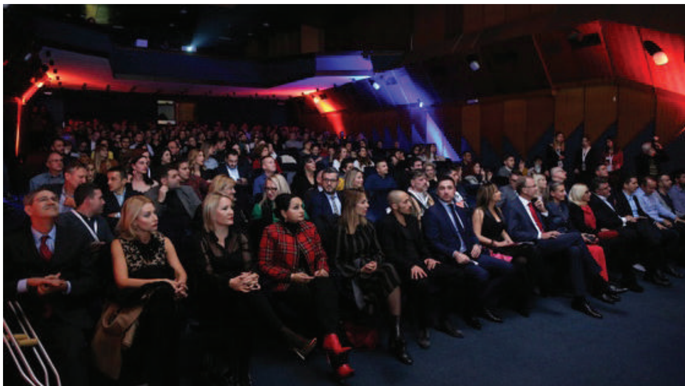
Detalj iz publike sa otvaranja Festivala

Ovogodišnje izdanje zabilježilo je veliko interesovanje publike, a tokom pet dana repertoara premijerno je prikazano 15 filmova, različitih žanrova. Bez obzira na raznovrsnost, tematika svih filmova publici je ponudila snažne poruke, koje su imale