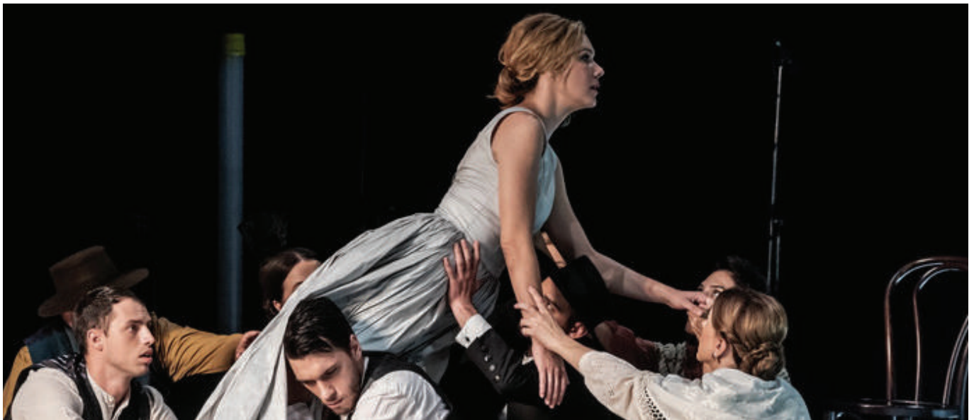
Detalj iz Lorkine drame „Krvave svadbe“

Druge festivalske nagrade „Ardalion“ dodijeljene su u devet kategorija. Predstava „Zašto je poludeo gospodin R“, Rajnera Vernera Fasbindera, Jugoslovenskog dramskog pozorišta iz Beograda, trostruki je laureat ovogodišnjeg izdanja užičkog Festivala. Jednoglasnom Odlukom Žirija, ovaj naslov dobio je Nagradu ARDALION ZA