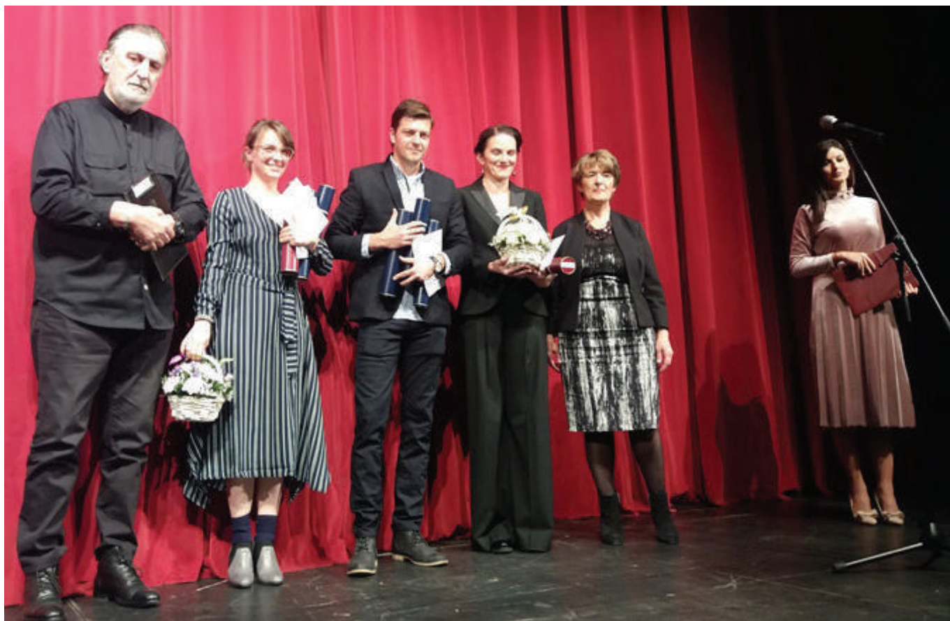
Detalj sa uručenja nagrada na sceni Nikšićkog pozorišta

Uz simboličan novčani iznos, glumcima su na zatvaranju Festivala uručene i namjenski urađene plakete. Laureati Festivala ponijeli su iz Nikšića lijepe utiske i uspomene. Prvim izjavama potvrdili su da je ovo glumačko nadmetanje jedinstveno, a