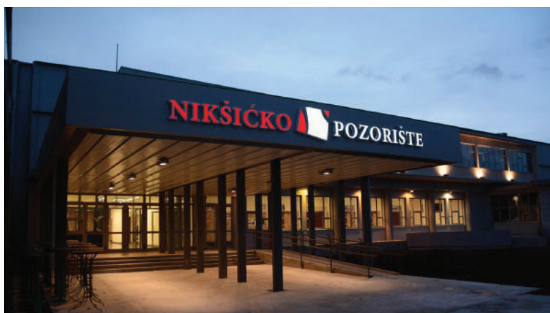
Nikšićko pozorište čuva i njeguje pozorišnu tradiciju

Nikšićko pozorište će 16. februara obilježiti značajan jubilej - 135 godina pozorišne tradicije. Taj datum, Statutom ustanove od 2006. godine, definisan je kao Dan Nikšićkog pozorišta . Ustanovljen je u znak sjećanja na daleku 1884. godinu, kada je u tek oslobođenom Nikšiću izvedena prva predstava „Slobodarka“, Manojla Đorđevića Prizrenca , ili kako su je tadašnji hroničari zabilježili „prva iza prve“ u Crnoj Gori, nakon što je mjesec i po ranije na Cetinju izvedena „Balkanska carica“, Nikole I Petrovića Njegoša .