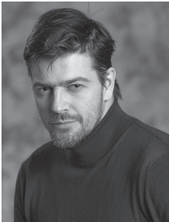
Bukvić: „Publika je željna pozorišta“

Amar Bukvić je popularni hrvatski glumac i jedan od najtraženijih glumačkih imena u Hrvatskoj i regionu. Po završetku Akademiju u Zagrebu, 2006. godine, Bukvić uspješno gradi svoju karijeru u: pozorištu, na televiziji i filmu. Prvu ulogu u filmu odigrao je još kao student 2003. godine, u naslovu