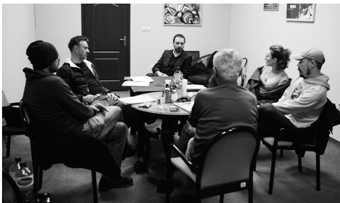
Detalj sa proba „Čekajući Godoa“