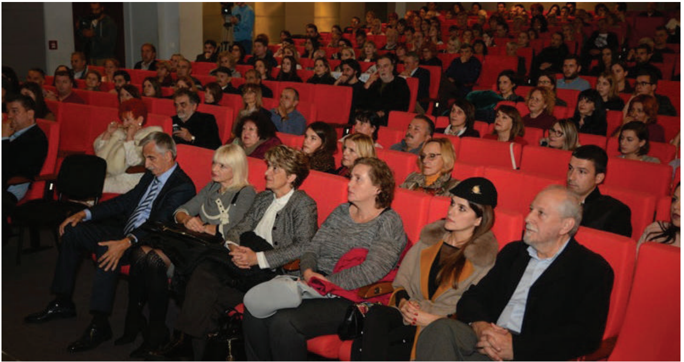
„Međunarodni festival glumca Nikšić 2018“ / detalj iz publike

S druge strane, predstava je prošla savršeno. Svi glumci su bili jedno tijelo i duša. Veoma se radujem zbog Zorana Ivanovskog, koji je igrao