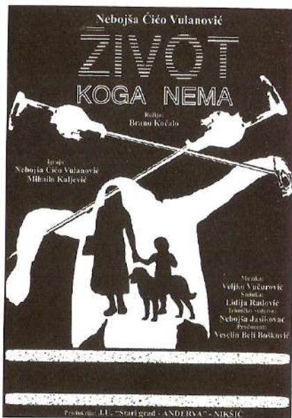
Legenda: Život koga nema – plakat