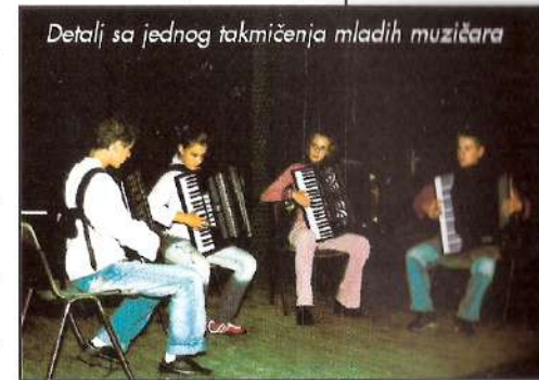
Detali sa jednog takmičenja mladih muzičara

osnovno muzičko obrazovanje stiže 503 učenika, na smjerovima klavira, harmonike, gitare, kao i na odsjecima za gudačke i duvačke instrumente.