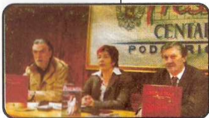
Sa Presa u Podgorici

Govoreći o predstojećem festivalu, Bulajić je rekao kako je cilj "Nikšićkog pozorišta" da grad pod Trebjesom postane festivalski i pozorišni centar Crne Gore. On se nada da će "Nikšićko pozorište" jedinstveni jubilej u 2009. – oj godini (na dan 125. godina rada) obilježiti u svojoj pozorišnoj sali.