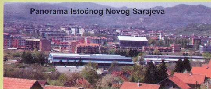
Panorama Istočnog Novog Sarajeva

se mogućnost da 'ugostimo' i predstave koje su tehnički zahtjevnije. Istina, još uvijek nemamo profesionalno pozorište niti veliku scenu, ali postojeća - kamerna je idealna za ovu formu Fe-