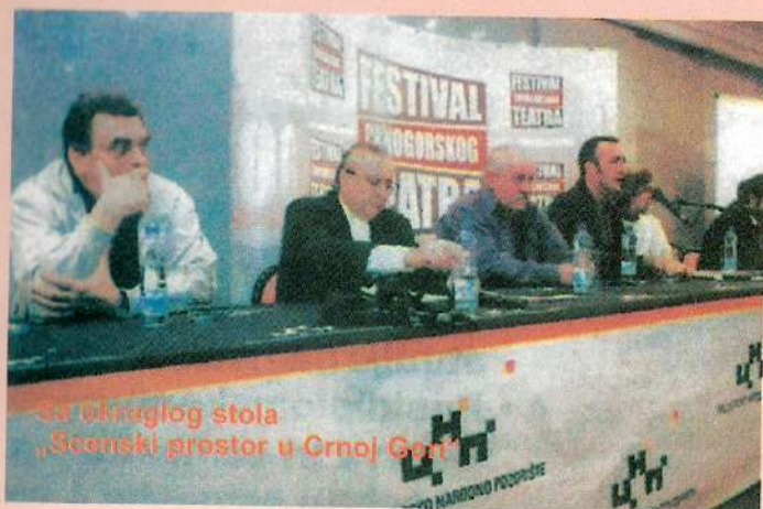
Na okruglog stola „Scenski prostor u Crnoj Gori“

„ Scenski prostor u Crnoj Gori “ – tema je okruglog stola koji je organizovan u sklopu pratećeg programa Drugog Festivala Crnogorskog teatra.