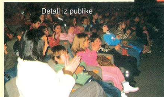
Detalj iz publike

tovo da je vidljivo gdje ko griješi i koliko je svako od njih spreman da prizna grešku. Na kraju priče svi njeni junaci shvataju gdje su i zbog čega su tu, što je i osnovna poruka predstave“, kazao je za „ Pozorište “ glumac Nebojša Mašić .