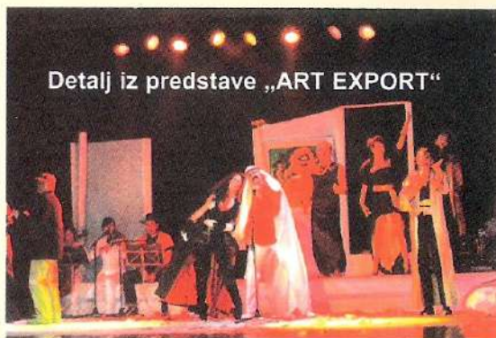
Detalj iz predstave „ART EXPORT“