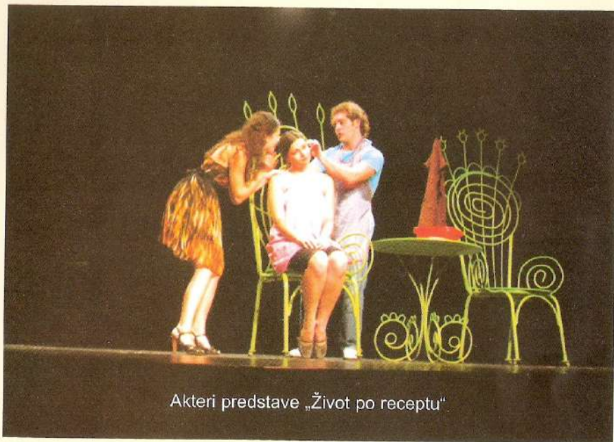
Akteri predstave „Život po receptu“

Nikšićka publika je imala priliku da, početkom pozorišne sezone 2008/2009., odgleda dvije diplomske predstave studenata Fakulteta dramskih umjetnosti sa Cetinja: „Život po receptu“ i „Stand up“.