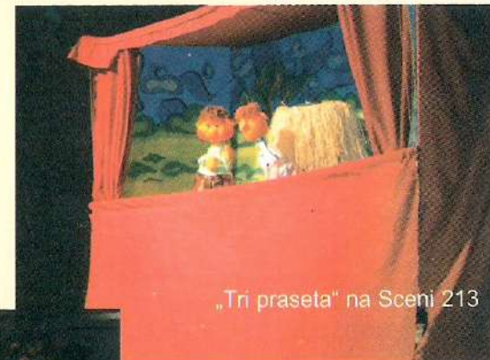
„Tri praseta“ na Sceni 213

„ N ikšićko pozorište“ je, cijeneći značaj edukacije najmlađe publike, početkom decembra na Sceni 213 ugostilo novosadski ansambl Pozorište lutaka „ Abrakadabra“ sa predstavom „ Tri praseta “. To je drugo gostovanje Novosadana u Nikšiću, jer su u martu ove godine u Nikšiću igrali lutkarsku predstavu „ Radosna vijest “. Drugi njihov susret sa nikšićkim osnovcima potvrdio je pretpostavku da su ovdašnja djeca željna pozorišnih priča u lutkarskoj formi. Interesovanje je bilo veliko... Za tri dana predstavu je odgledalo oko tri hiljade učenika nižih razreda, iz dvanaest osnovnih