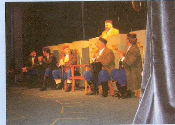
„Detići“ u Istočnom Novom Sarajevu

Nikšića, Beograda i Istočnog Novog Sarajeva. Režiser će, najverovatnije, biti iz Crne Gore, tekstopisac iz Beograda, pomoćnik reditelja iz Banja Luke, a scenograf iz Podgorice. Predstavu ćemo koncipirati tako da se može igrati na svim scenama. Premijera bi trebalo da bude na sljedećem Festivalu u Istočnom Novom Sarajevu. Ja sam, inače, pristalica ko-produkcijskih predstava i razmjene programa. Mi imamo izvanrednu saradnju sa pozorištima Kraljeva, Kruševca, Užica, „Slavija teatrom“, sa Ateljeom 212, Narodnim pozorištem iz Banja Luke i Novog Sada“, rekao je Zelenović za „Pozorište“.