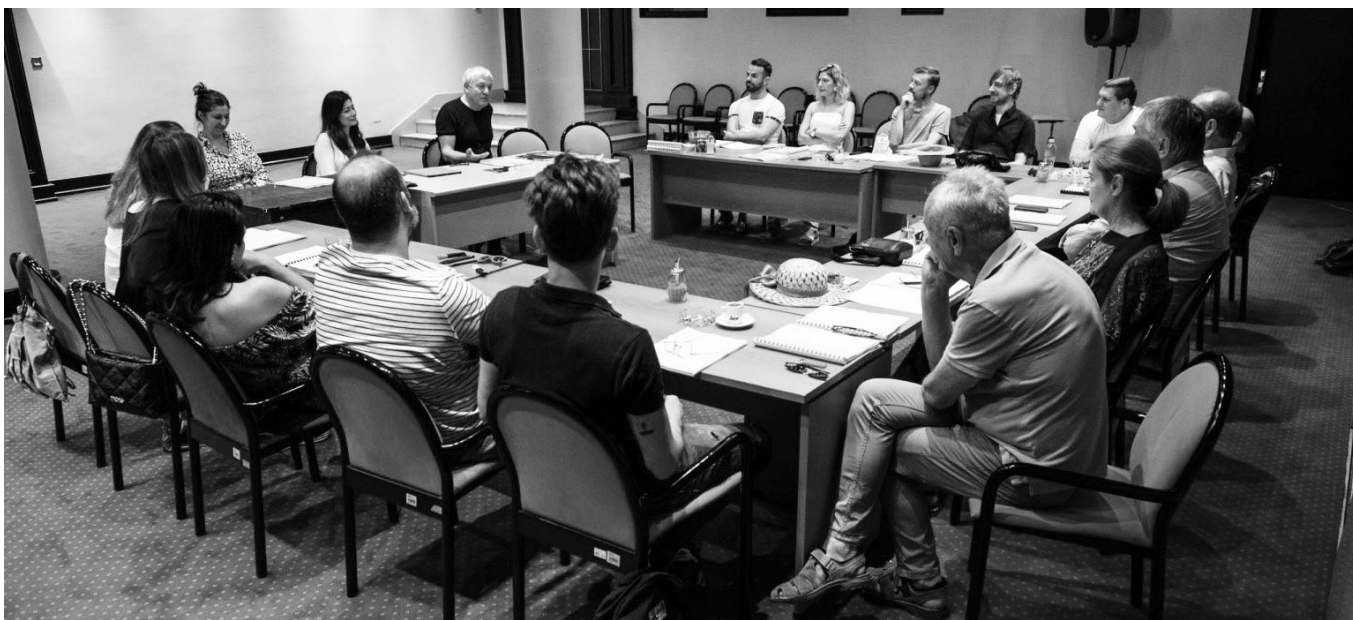
„Покојник“, Бранислава Нушића – детаљ са проба