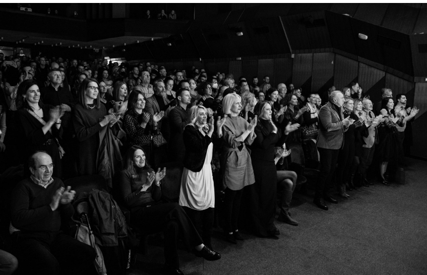
Публика на премијери

овој представи је да једна позоришна трупа долази да игра „Укроћену горопад“. У основи је прича о позоришној визији и гдје се налази реалност, да ли је на сцени или у публици, што одражава велику Шекспирову тему о сну и реалности. ... Метатеатралност код Шекспира је један од основних принципа и ви никада не можете бити тотално у театру и када