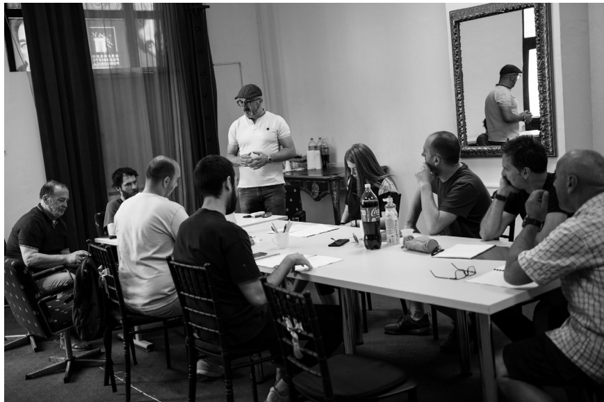
„20.000 миља под морем“ – детаљ са читаћих проба

Градско позориште са овим пројектом наставиће са репертоарском оријентацијом сценских причања чувених бајки које су неизоставни дио дјечијег одрастања.