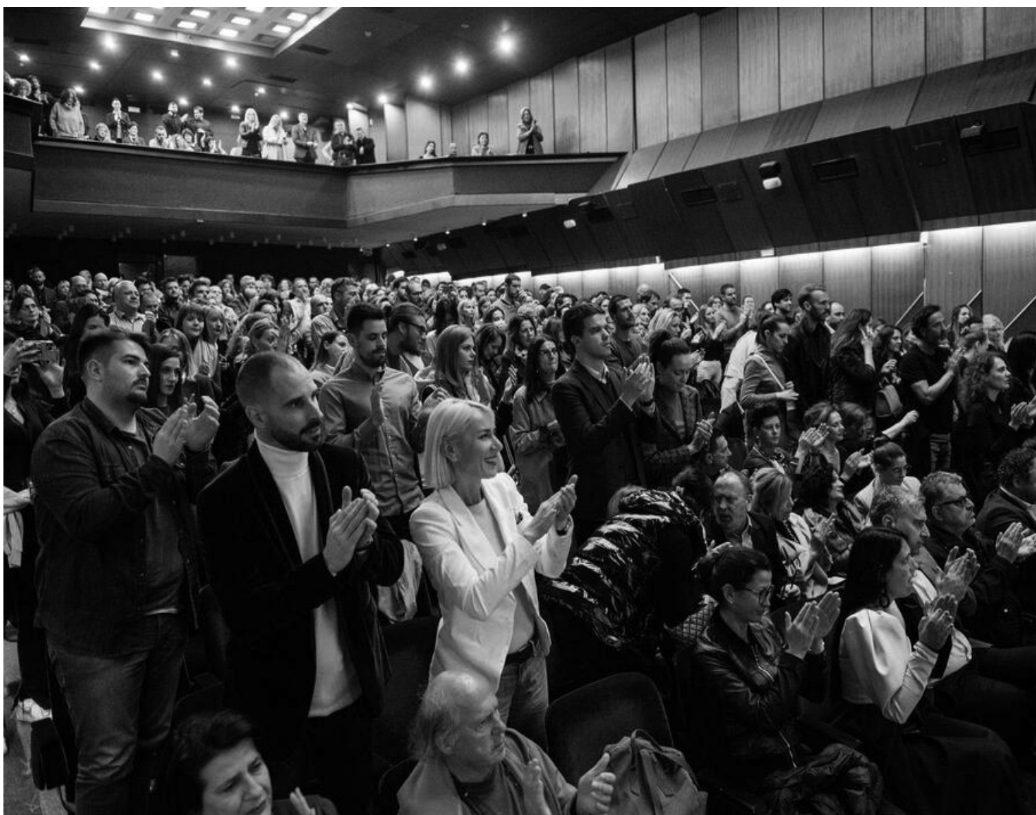
Публика на подгоричком издању РУТА фестивала

Наредно издање фестивала РУТА ГРУПА ТРИГЛАВ заказано је у Сарајево у јуну.