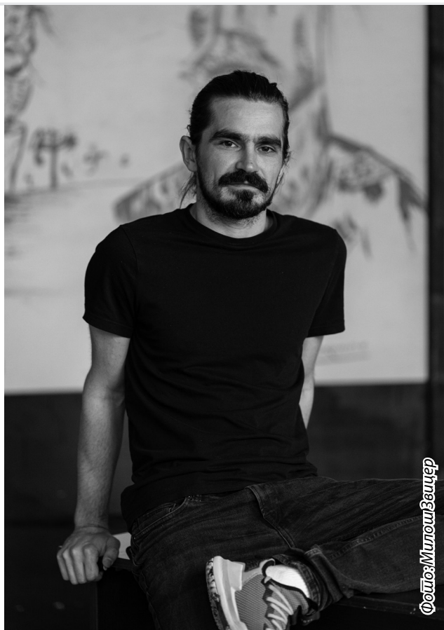
Фото: Милош Велцер

Текстуални предлог није сам по себи актуелан, него га ми заправо нашом пошавком, у овом садашњем тренутку и контексту, актуализујемо. Кад кажу да Шекспира или Молијера треба играти онако како га је он написао, што је апсурдно. Јер као прво, ми не можемо поуздано знаћи како је