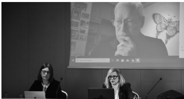
Са панел дискусије у Подгорици

Иницијални састанак са кључним актерима на пројекту „Креативна економија – Развој политика у области филмске индустрије у Црној Гори“ ( Creative Economy Policy Grant Scheme ), који се реализује у партнерству Филмског центра Црне Горе и British Council-a , одржан је половином марта у Подгорици.