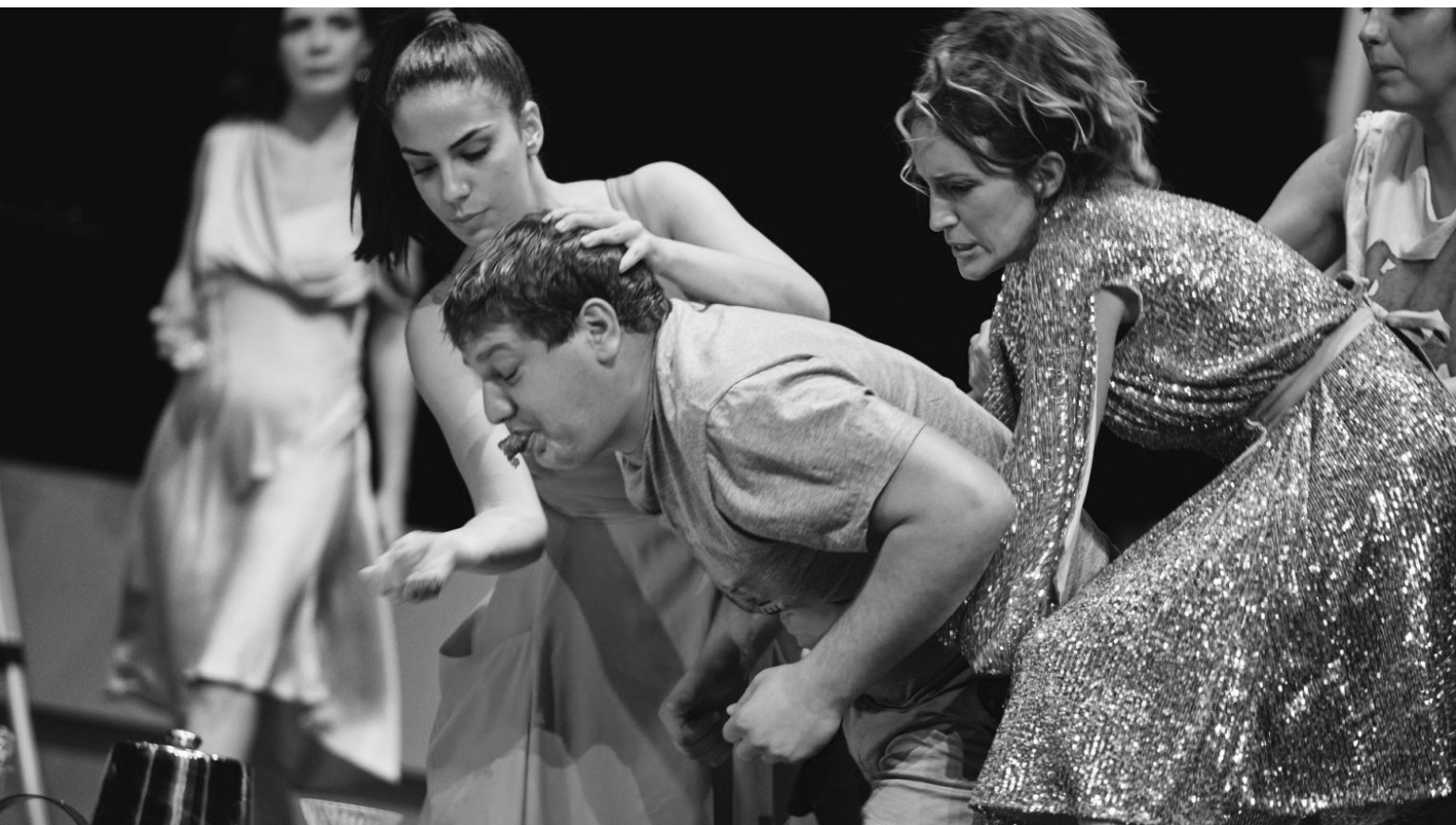
Са извођења „Блади Муна“ у Сарајеву

Сарадња с Црногорским народним њозоришњем била је и њовод да се исњакне изузетно усњјешна сезона у њогледу осњварених гостивања али и рекордног броја фестивала на којима ће Народно њозоришње Сарајево узетњи учешће до краја умјетничке сезоне.