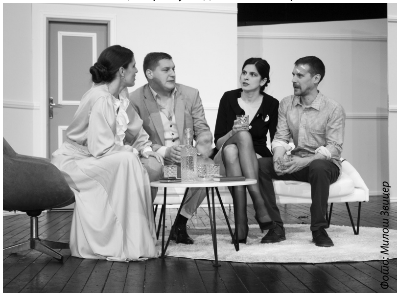
„Боинг – Боинг“ поред катарзе доноси: радост, смијех и љепоту игре

Никшићко позориште је успешним премијерним извођењем комедије „ Боинг – Боинг “, познатог француског писца Марка Камелотија , почетком маја обиљежило позоришну сезону не само сопствене, већ и црногорске позоришне продукције, имајући у виду да се тај комедиографски поджанр није дуго инсценирао у овдашњим позориштима.