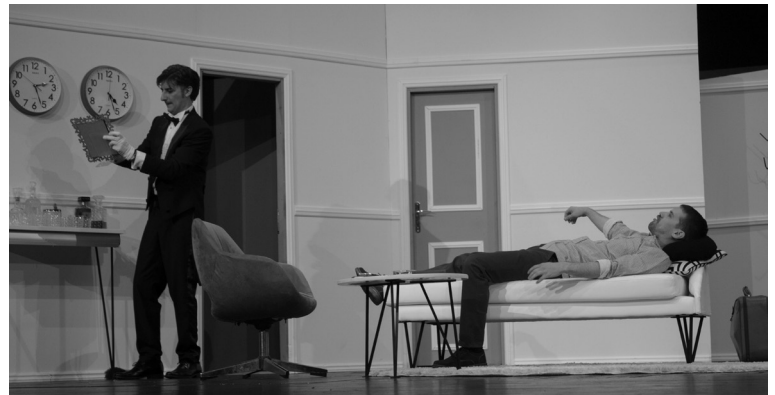
„Боинг – Боинг“ (Никшићко позориште) прва професионална представа Ђојића

Никшић ће увек имати посебно мјесто у мом срцу не само због прве професионалне представе, већ и због људи са којима сам се срекао и радио и искрених пријатеља које сам сјекао. Желим овом позоришту све најбоље. Оно има сјајне људе и добру вољу, али за веће домашње потребна му је и већа слобода и подршка. Надам се да ће то преиспитати они који требају и да ће Никшићко