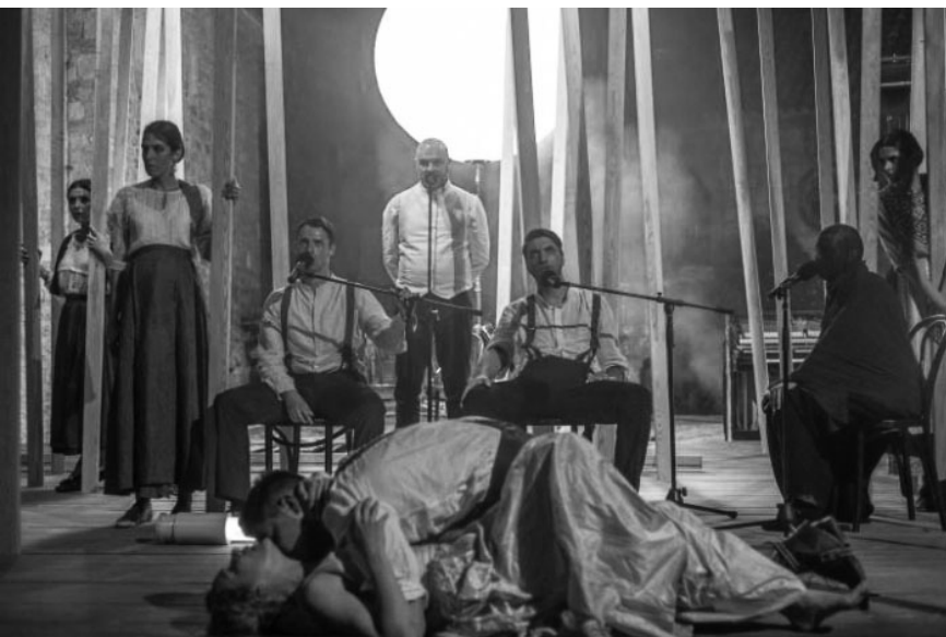
Магично естетизована прича о истинској љубави која разбија подигнуте зидове

Представа „Крваве свадбе“, копродукција „Град театра“ и Српског народног позоришта Нови Сад из 2018. године, изведена је током ревије „Игорови дани“ у Новом Саду, 25. јануара,