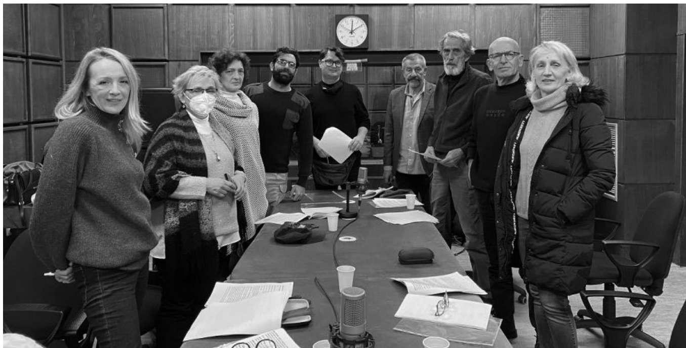
Екипа „Бицикличкиког устанка“ са снимања у студију Радија Црне Горе