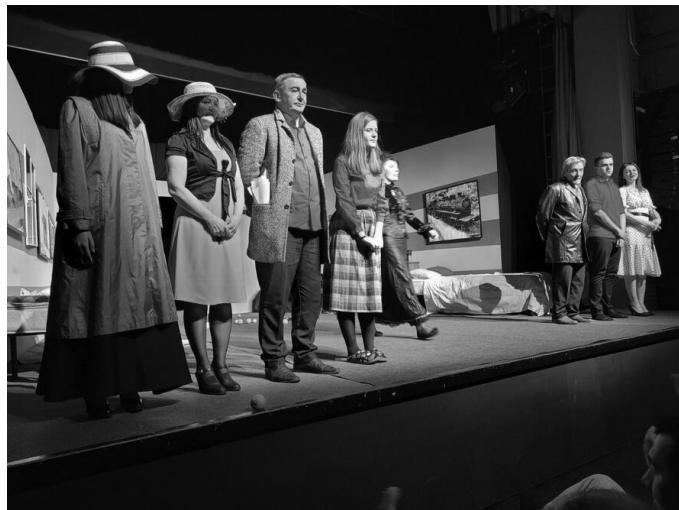
„Данило“, химна за црногорску мајку

Осим што је овим својим ауторским пројектом тежио да направи химну о хероинама и црно-