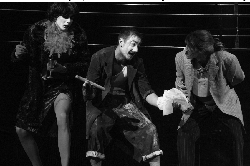
„Пошто гвожђе“ у режији Ђојића вишеструки лауреат награда на фестивалима

Минули вијек, према неким теоретичарима драмске умјетности, препознат је као „ера редитеља“, а на 21 вијек се гледа као на период који у „у центар поставља глумца“... Колико су те препознатљивости могле и могу утицати на развој драмске умјетности, посебно због убрзаног технолошког развоја у којем доминира дигитална технологија? Свједоци