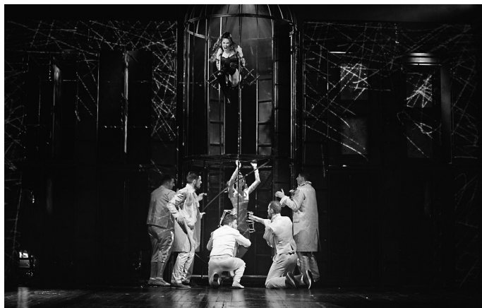
Око 1500 гледалаца уживало на премијери

„Укроћена горопад“ није материјал за по-