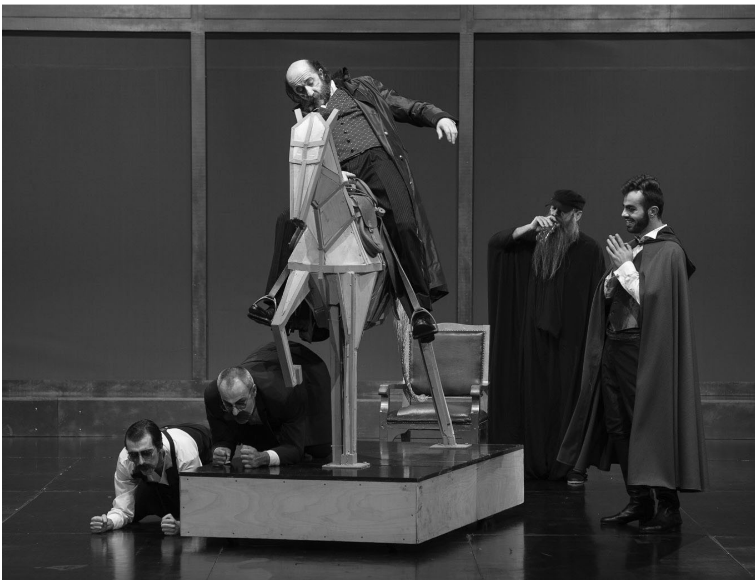
„Шћери моја“ – лауреаи бројних пресџијжних признања