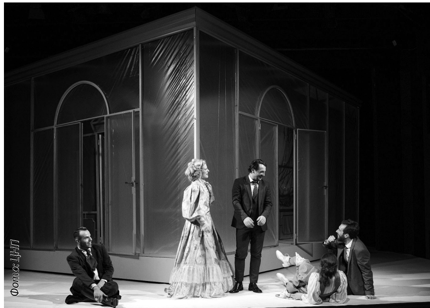
Комад има јасну алузију на данашње вријеме

Највише сам била сконцентрисана на свој лик, на оно што сам ја тумачила, а то је била Лиза. Била ми је занимљива њена дефиниција да је болесна, јер ја нисам сматрала да она има било какву дијагнозу. Пронашла сам неку ниш између мене и ње, како бих могла да изне-