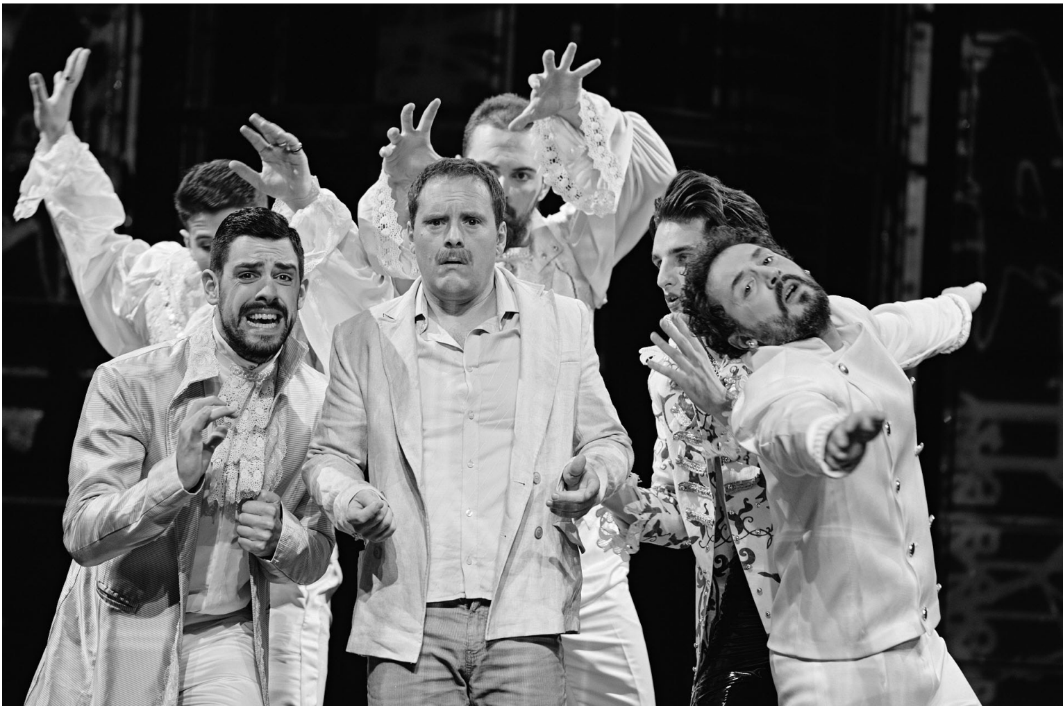
Редитељ Пројковски: „Шекспир је цио универзум“

Шекспир је цио универзум који сам по себи садржи све одговоре на прошлост, дилеме и питања садашњости и пророчанства будућности. Текст „Укроћена горопад“ написан је у доба касне ренесансе, али удахњује нашу модерност кроз теме и проблеме драме, које су заправо саставни дио и наших живота. Комад је данас посебно актуелан јер се доводи у питање род. Шекспир нас увијек враћа на извор основних принципа људског бића. Али ми нећемо ништа рећи на нашу тему, ако не поставимо питање: да ли постоји специфични женски смисао, који се разликује од мушког?