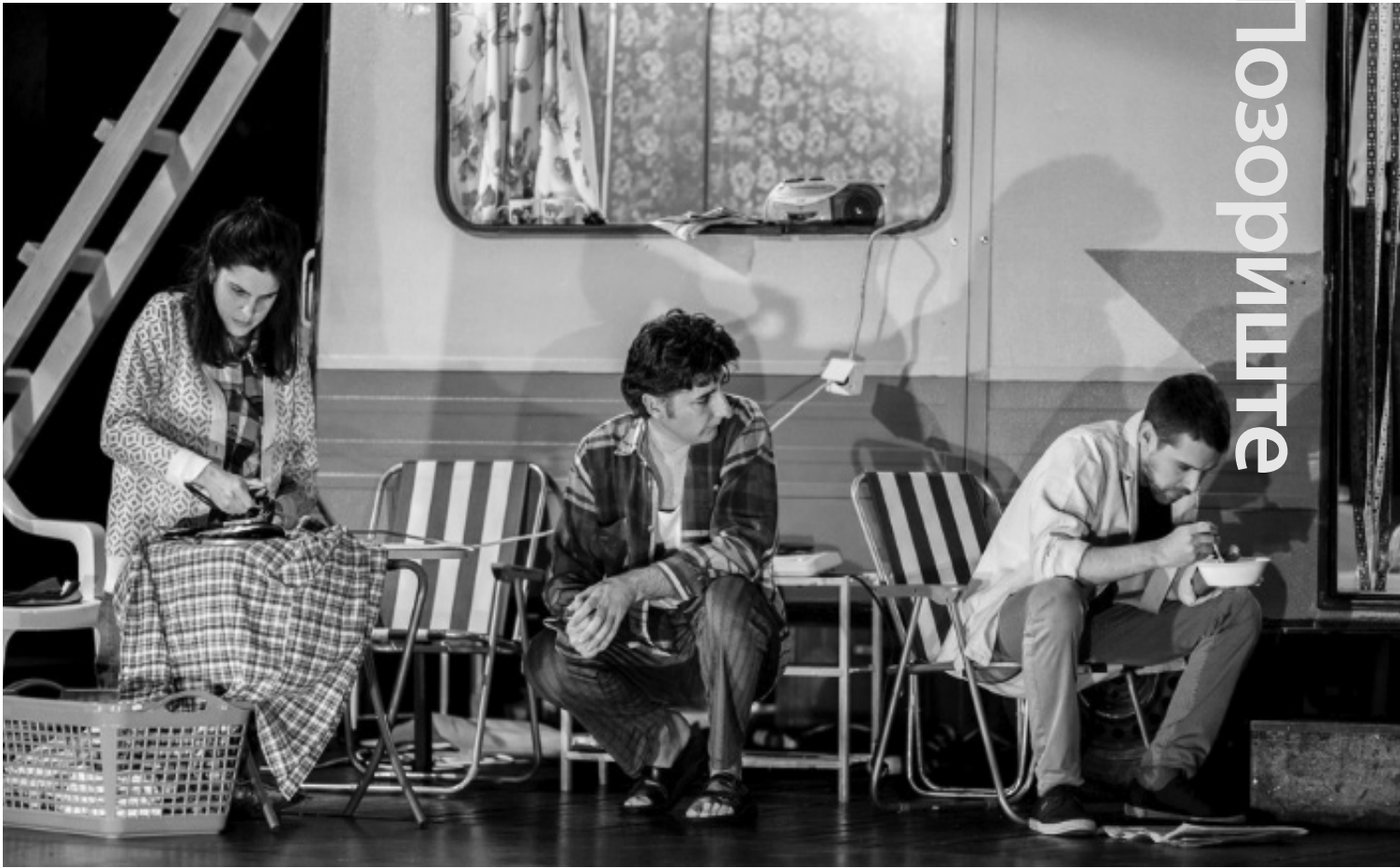
Породична сага о „поцијејаном небу“

То је прича која указује на поларизације у друштву, као и на дуалности које стоје иза тих феномена. Ова реалистична драма бави се лепезом тема: лицемјерјем, отуђеношћу, промискутетом, преваром, класним и другим питањима. Озборнове ликове који проговарају о религији, браку, изборима, слободама са увјерењима, а ријетко када са чињеницама, Ђорђевић је измјестио у необичну породичну сагу, апстракујући чињенице и истине, док је у први план ставио осјећања, увјерења и личне ставове.